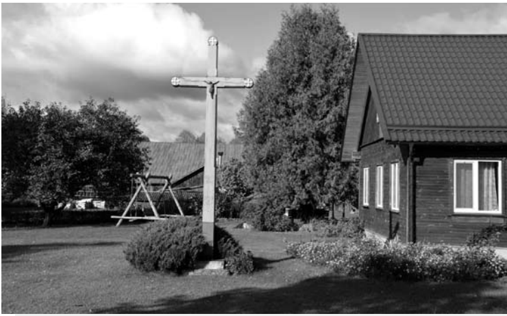
Šalaku sodybos kieme atstatytas kryžius toje pat vietoje, kur jis stovėjo ir iki ištremiant šią šeimą į Sibirą.