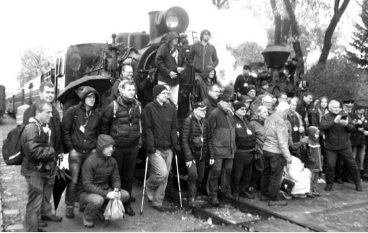
Į siaurojo geležinkelio bičiulių festivalį susirinko beveik pusantro šimto entuziastų.

Šeštadienį Anykščių geležinkelio stotyje vyko įsimintina šventė - mieste lankėsi XXVI-ojo Europos istorinių siaurųjų geležinkelių bičiulių suvažiavimo dalyviai, į senąją stotį iš Panevėžio atidundėjo net du tikrų tikriausi garvežiai, iš senovinio pabūklų saliuotavo anykštėnai šauliai, skambėjo sveikinimo kalbos.