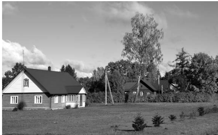
Pauriškių kaimo sodybos išsidėstę vienoje eilėje palei Anykščių-Rokiškio plentą.