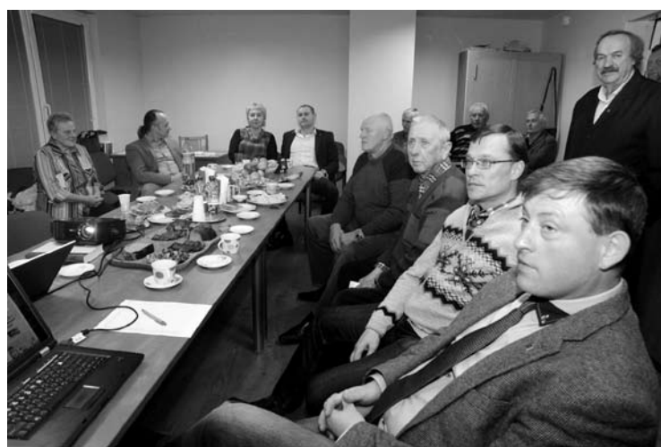
Anykščių socdemams rinkimų rezultatai progos pasidžiaugti nesuteikė

Seimo rinkimų pirmąjį turą šalyje laimėjo Lietuvos valstiečių ir žaliųjų sąjunga. Daugiamandatėje apygardoje ši partija iškovojo 20