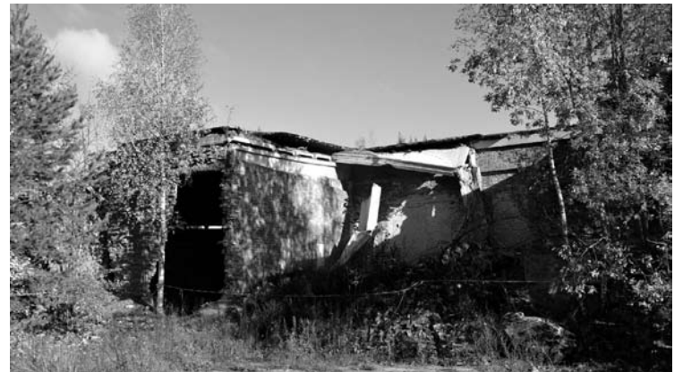
Jau daugelį metų Pauriškius „puošia“ ir visus šturpina buvusios plytų gamyklos griuvėsiai.