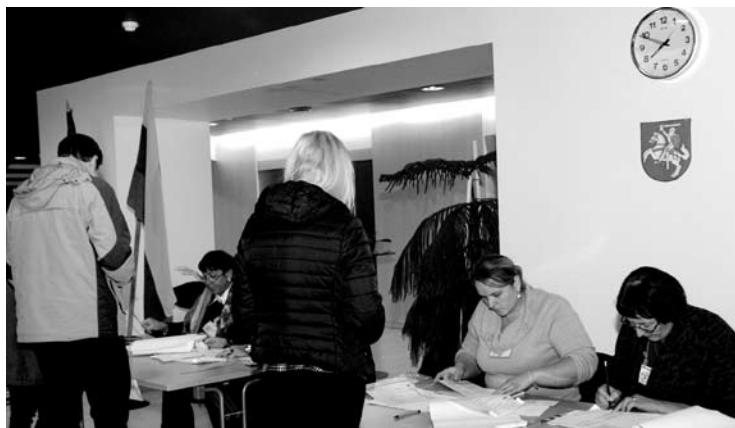
Anykščių-Panevėžio apygardoje sekmadienį balsavo 50,44 proc. rinkėjų.

(Atkelta iš 1 p.) Pergalės ženklas – mažų apylinkių rezultatai