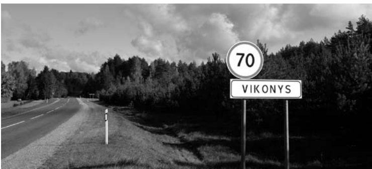
Keliauji pro Pauriškius, o ženklai rodo, kad ši vietovė yra Vikonys.